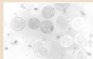
Elektronenmikroskopische Aufnahme von mehrschaligen Liposomen.

Die Lipidbausteine der mehrschaligen Liposome kommen bereits von Natur aus als Bestandteile der Hautzellen vor. Dies ist die Basis für eine besonders gute Verträglichkeit. Der Verzicht auf Konservierungsmittel und Parfüm ist wegen der Einschleusungsgefahr für uns selbstverständlich.